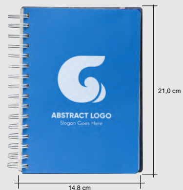
Medidas das folhas dos planner, a capa a dimensão é um pouco maior.