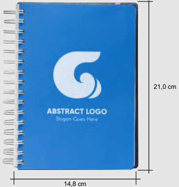
Medidas das folhas dos planner, a capa a dimensão é um pouco maior.

POSSIBILIDADE DE FAZER A PERSONALIZAÇÃO COM SEUS NOMES E LOGO