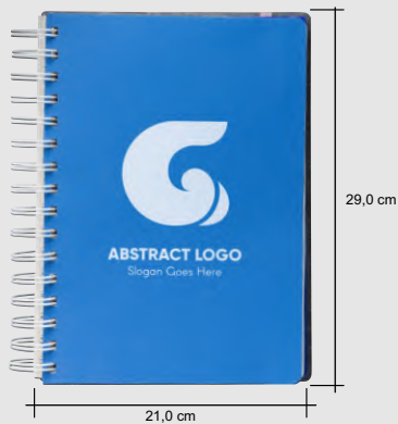
Medidas das folhas dos planner, a capa a dimensão é um pouco maior.